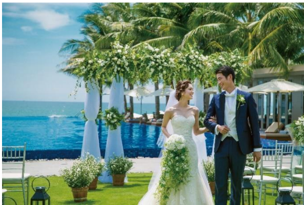
<「ナマンリトリート」ガーデン挙式・パーティ イメージ>