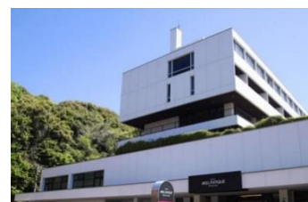
ホテル メルパーク松山