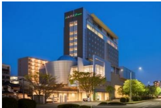
ホテル メルパーク仙台