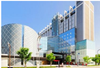
ホテル メルパーク長野