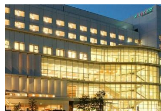
ホテル メルパーク熊本