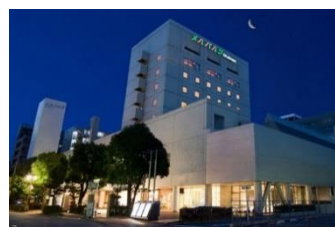
ホテル メルパーク岡山