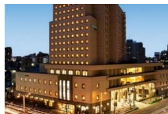
ホテル メルパーク名古屋