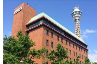
ホテル メルパーク横浜