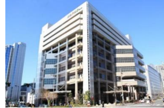
ホテル メルパーク大阪