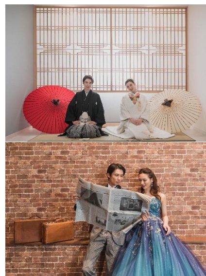
<フォトスタジオ撮影イメージ>

URL： https://www.watabe-wedding.co.jp/photo/shop/nagano/