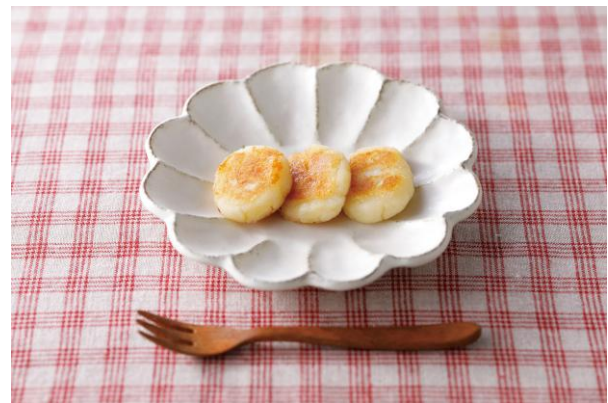
ポテトチーズおやき