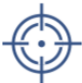
買い注文で1,000円の指値を指定した場合