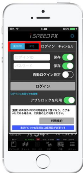
「楽天 FX ログイン画面」