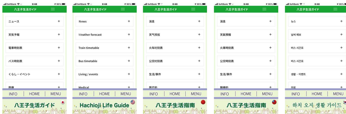
八王子生活ガイド（左から、日本語・英語・中国語（簡体字・繁体字）・韓国語）