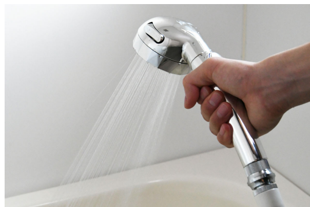
高回転モードはホースのねじれ無しで快適に使用が可能