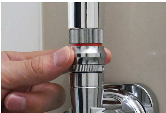
二種類のモードをスイッチ一つで切り替え

使用方法はシャワーヘッドとホースを取り外し、その間に取り付けるだけ。使用時のストレスを無くし、シャワー体験をより快適なものへと生まれ変わらせるシャワーアダプターです。