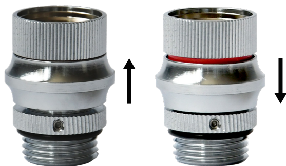
高回転モード (スイッチを上げる) 低回転モード (スイッチを下げる)

高回転モードと低回転モードは片手でのワンタッチ切り替えが可能で、低回転モードの時は商品本体に赤いラインが見え、どちらのモードかが分かりやすい仕様です。