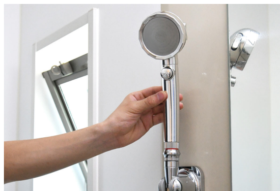
低回転モードで回転具合を調整