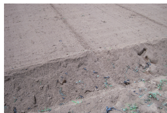
シートすき込み後

使い捨てプラスチックが減少し、農業従事者の負担を減らす生分解マルチシート『NINJAマルチ』をより多くの方に知っていただき、日本農業の発展に微力ながらも貢献したいと考えています。