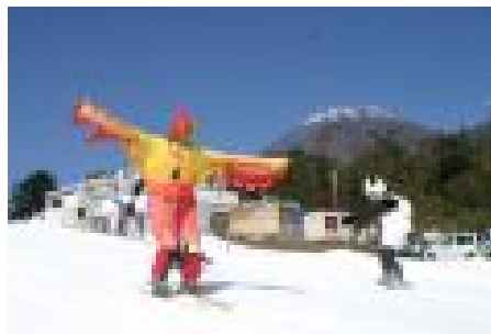
写真は昨年のコンテストの様子