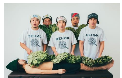
しらかばスポーツ