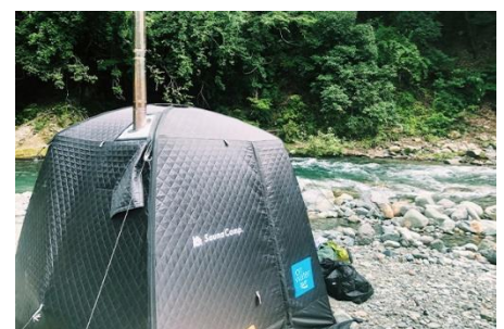
テントサウナ(イメージ)