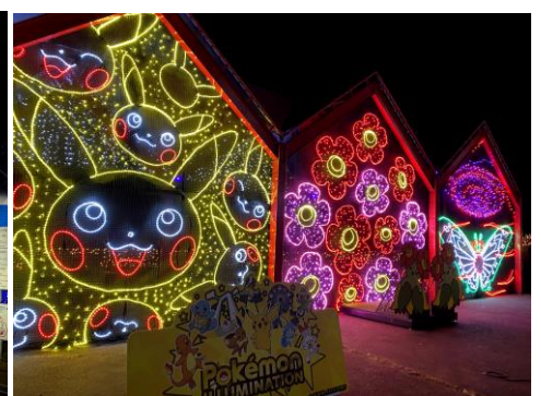
ポケモンストリート