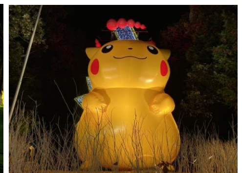
ピカチュウ キョダイマックスのすがた