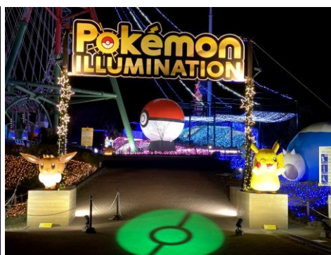
ポケモンストリート