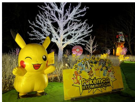
ピカチュウの光の森