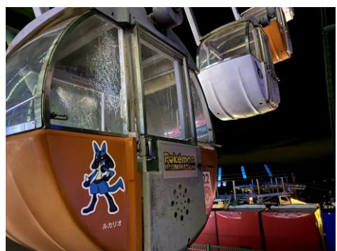
ポケモンゴンドラ