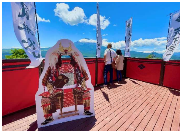
武田信玄なりきりフォトスポット