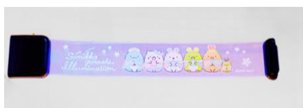
光るブレスレット 900円