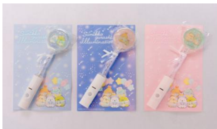
光るキャンディ (全3種) 680円