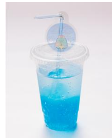
しゅわしゅわすみっコド リンク(全5種) 700円 ※ストローチャーム付き