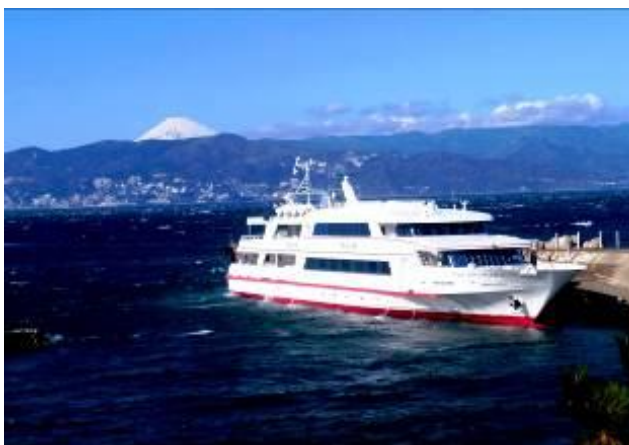
イルドバカンス 3 世号