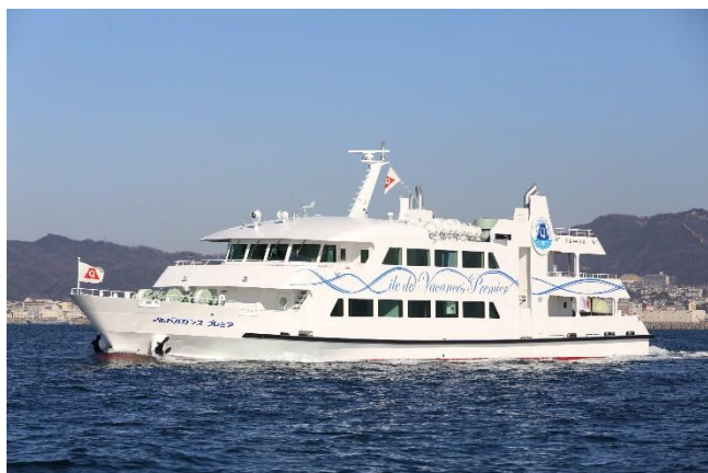
イルドバカンスプレミア