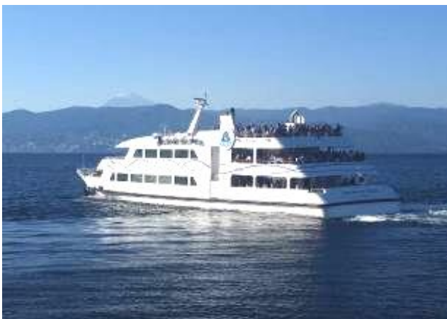
イルドバカンスプレミア

「イルドバカンス」は、熱海港～初島港を結ぶ高速クルーズ船で、「イルドバカンス プレミア」(定員 605 名)と「イルドバカンス Ⅲ世号」(定員 868 名)の 2 隻が運航しています。展望デッキに出て 360° 広がる海や富士山を眺めたり、冬季はカモメにエサをあげることもできます。