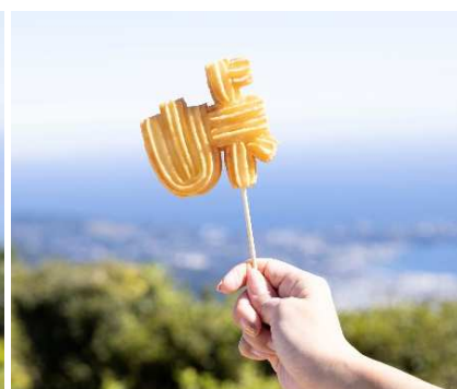
峠チュロス 500 円