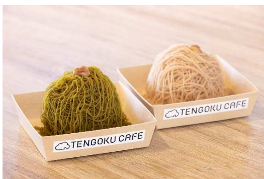
1059 モンブラン(静岡茶/マロン) 各 1,000 円