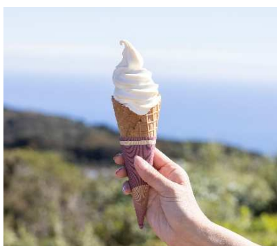
特濃ソフトクリーム ～地元 丹那牛乳使用～ 500 円