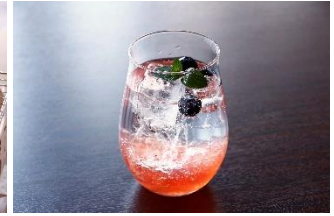
山梨県産フルーツジュレ ソーダ 650 円