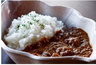
山梨県産信玄どり スパイスカレー 1,350 円