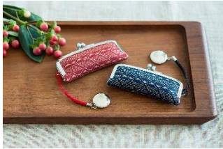
印傳 富士山柄 印鑑ケース 1,870 円

山梨で 400 年余の伝統を誇る鹿革に漆で模様をつける伝統工芸品「印傳」の富士山柄小物から、富士山をかたどった杯(さかずき)などの雑貨類をはじめ、桃や金木犀の花びらを閉じ込めた山梨県産ジャムや、富士山の溶岩を熱し遠赤外線による低温焙煎「富士山溶岩焙煎珈琲」などを取り揃えました。