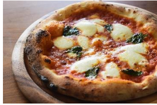
もちもちナポリ風ピッツ ァ マルゲリータ 1,300 円