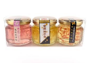
花びらジャム(桃・金木犀) 865 円