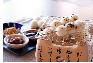
焼き団子 900 円