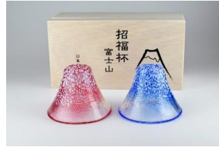
招福杯 富士山ペア冷酒杯 3,300 円