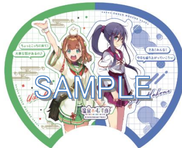
(熱海・箱根エリア、表面) 熱海初夏&箱根彩耶