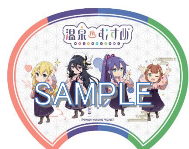
(両エリア共通、裏面)

さらに、期間中エリア内の各施設売店にて、税込1,000円以上商品を購入した方に、オリジナルポストカードをプレゼントいたします。