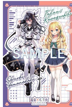
河口湖・山中湖エリア ポストカード