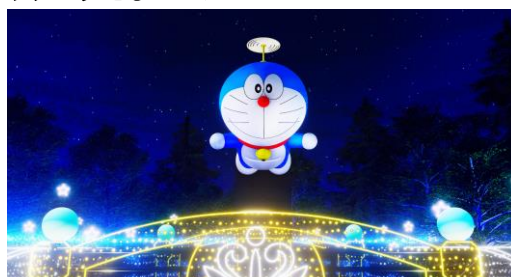
映画に登場する橋や川をモチーフにした橋の上をタケコプターで飛ぶ巨大なドラえもんのバルーン

そのほか、「タケコプター」や「どこでもドア」などの馴染みのあるひみつ道具や、映画のワンシーンをイメージしたイルミネーションも見どころです。