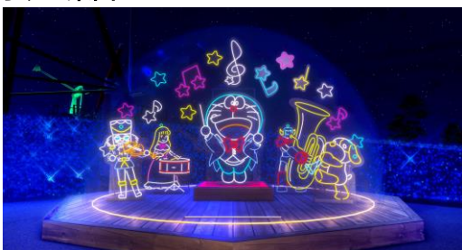
おもちゃの楽団と一緒に、ドラえもんが楽しく演奏する様子のイルミネーション