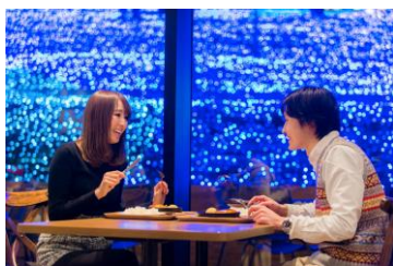
レストラン「ワイルドダイニング」

園内中心部にあるレストラン「ワイルドダイニング」では、イルミネーションの幻想的な景色とともに温かい料理を楽しめるほか、日帰り温泉施設「さがみ湖温泉うるり」も隣接しており、「イルミネーション」と「温泉」という冬の醍醐味を満喫することができます。隣接するアウトドア施設「PICA さがみ湖」では、BBQや焚火、宿泊もでき、1日を通して丸ごと遊園地を楽しむことができます。