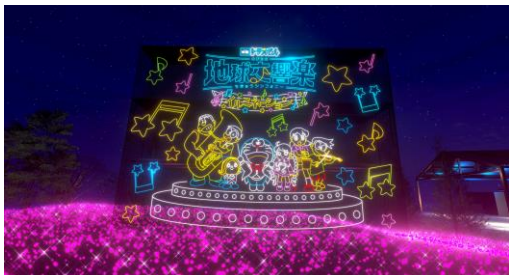
ゲストをお出迎えする巨大なイルミネーションアートウォール