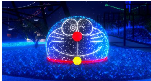
まあるいドラえもんの顔を半球体型のバルーンで表現したアイコン的なイルミネーション