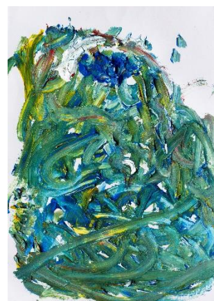
『蒼の富士』 けんたろうさん