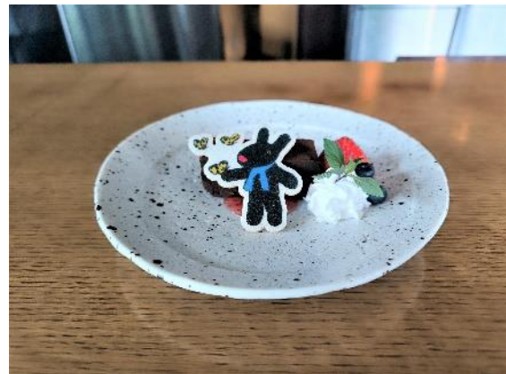
ガスパールの濃厚チョコレートケーキ 850 円