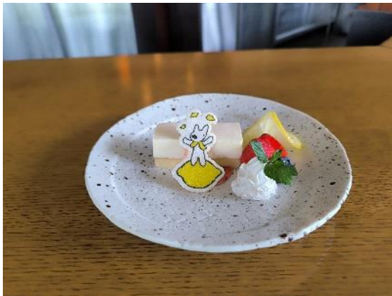
レモン香る リサのチーズケーキ 850 円