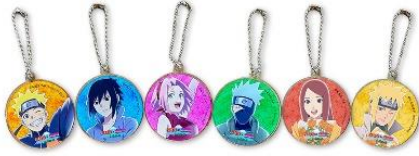
オリジナルチャーム

さらに、第一弾に引き続き、15,000円(税込)以上ご購入いただいた方には、オリジナルマルシェバッグをプレゼントいたします。