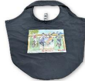
オリジナルマルシェバッグ