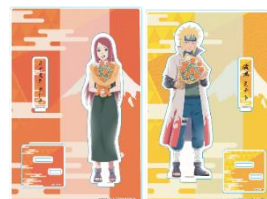
アクリルスタンド ※イメージ