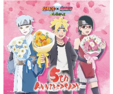
誕生日オリジナルデザインイラスト