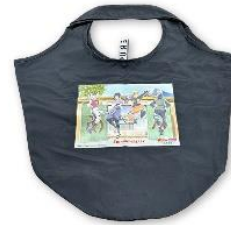
オリジナルマルシェバッグ