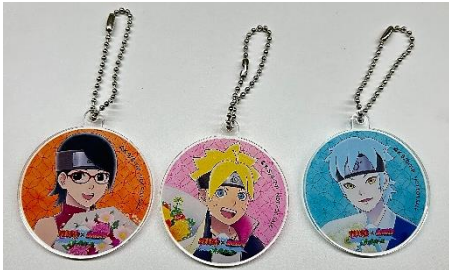
オリジナルチャーム※第三弾追加デザイン

5周年イベント期間中に「お土産処」で1会計4,000円(税込)毎にご購入の方に、オリジナルチャームを1つプレゼントしております。第三弾では、第一弾で登場した4種のチャームに加えて、ボルト・サラダ・ミツキの描きおろしデザインのオリジナルチャームが登場します。さらに、第一弾に引き続き、15,000円(税込)以上ご購入いただいた方には、オリジナルマルシェバッグをプレゼントいたします。