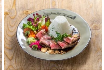
彩りローストビーフプレート 2,800 円