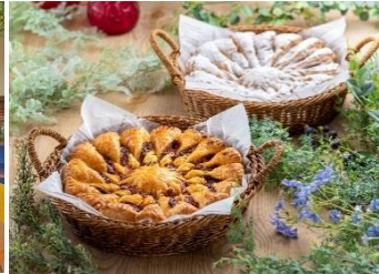
ブルームパイ 各 3,800 円 上：ベリー&ホワイトチョコ 下：ミートソース