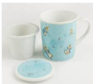
ティーストレナー付きマグカップ 2,500円