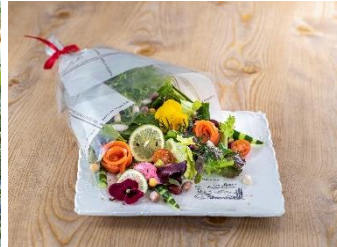
マグレガーおじさんの とれたて野菜のブーケサラダ 1,800 円