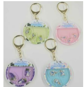
フレークキーホルダー(4種) 1,100円