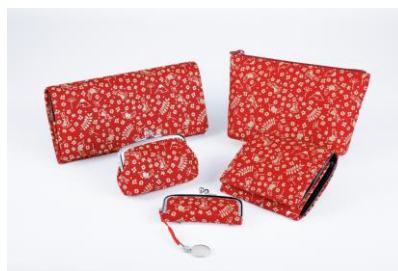
甲州印伝商品一覧