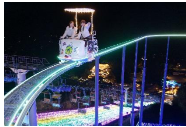
たまごっちのほしぞらべだる