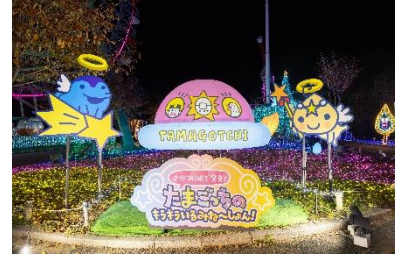
あの！ごっち UFO がやってきた！