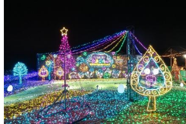
みんなしゅ〜ご〜！ キラキラいるみね〜しょん