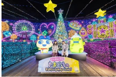
まめっちとくちぱっちのたまともリフト

https://www.sagamiko-resort.jp/tamagotchi_illumini/