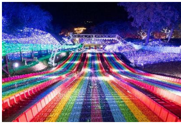
マジカルウェーブ

2025年夏にオープンした全長100mのスライダー「マジカルウェーブ」と、標高370mの空中を自転車で漕ぎ出す「青空ペダル」が、夜限定の特別演出として楽しめます。マジカルウェーブでは、鮮やかに光る100mのコースを一気に滑り降りるスリルと爽快感を、青空ペダルは、「さがみ湖で発見！たまごっちのキラキラいるみね〜しょん！」エリア登場にあわせて、「たまごっち」仕様の「たまごっちのほしぞらべだる」として、眼下に広がるイルミネーションを見下ろしながら天空サイクリングを満喫できます。さらに毎年人気の、虹色の光に包まれながら空中散歩を楽しめる「虹のリフト」とあわせて、「三大体験型イルミネーション」として楽しむことができます。そのほか、「たまごっちのキラキラかんらんしゃ」や、カラフルにライトアップする「光の空中アスレチック」など、起伏に富んだアウトドアリゾートならではの、全11種のナイトアトラクションが楽しめます。