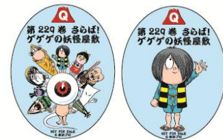
オリジナルステッカー ※イメージ