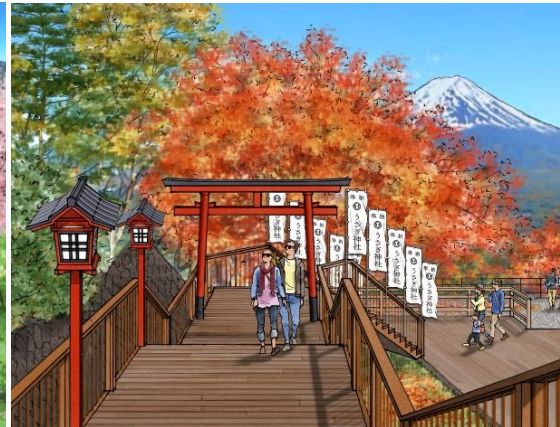
※絶景展望回廊 秋のイメージ

富士急グループの富士山麓電気鉄道株式会社（本社：山梨県富士河口湖町）が運営する「～河口湖～富士山パノラマロープウェイ」では、2026年7月16日（木）、標高約1,090mの山頂エリアに新名所『ご利益広場』と『絶景展望階段』をオープンいたします。