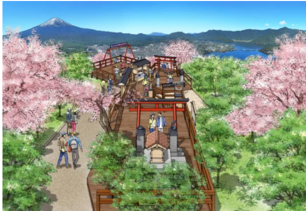
※ご利益広場 春のイメージ