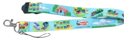
オリジナルネックストラップ