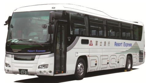
高速バス車両イメージ