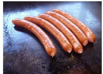
やまと豚の粗挽きウィンナー