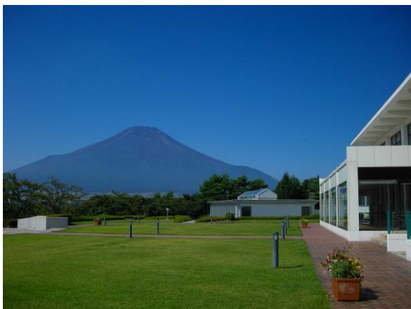
ホテルマウント富士