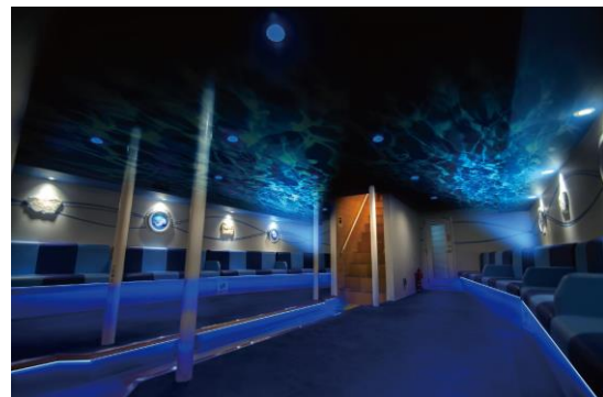
海の中にいるような上甲板下ルーム