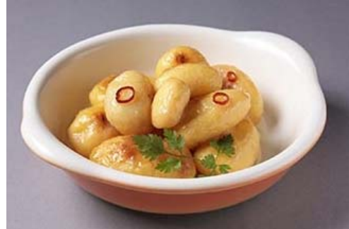
小さいアンチョビガーリック ¥800円(予定)