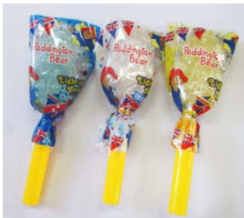
パディントンの光るアメ(3色) ¥550円(予定)