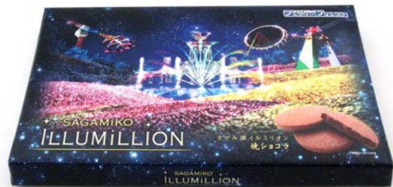
イルミリオン焼きショコラ ¥700円(予定)