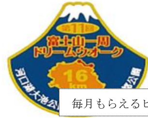
毎月もらえるピンバッジ