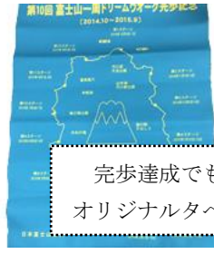
完歩達成でもらえる オリジナルペストリー