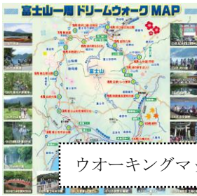
ウォーキングマップ