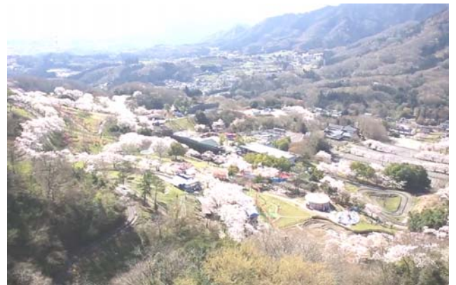
※ドローンで撮影したマッスルモンスターと同じ高さからの眺め