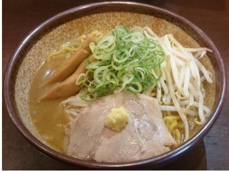
パクチー味噌ラーメン 800 円