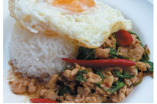
ガパオライス 1,000 円