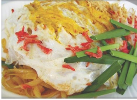
パッタイ 800 円