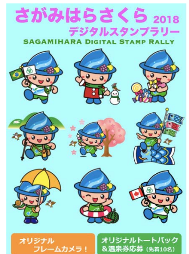
デジタルスタンプラリー 画面イメージ