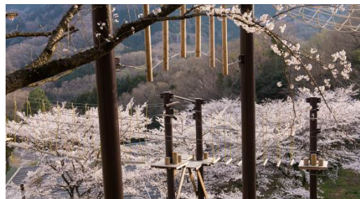
空中アスレチック「天狗道場」