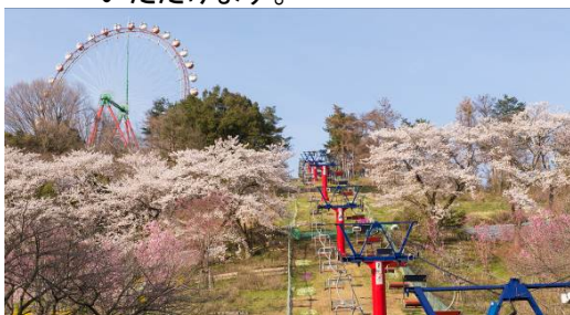
リフトから愛でる“空飛ぶ花見” (写真は過去のイメージ)

昨年3月にオープンした、アジア初上陸の絶壁から迫り出すアスレチック「マッスルモンスター」からは、遥か崖下に咲き誇る桜を見下ろしながら、最高の絶景・絶叫アスレチックをプレイしながら“ダイナミック花見”をお楽しみいただけます。