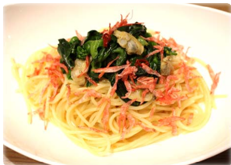
あさりと菜の花ペペロンチーノ 1,000円

“花より団子”派の方にもお楽しみを！園内のレストラン「ワイルドダイニング」では、8種類の春限定メニューを販売。また、期間限定でBBQの食べ放題プランを販売！メールから事前予約も可能で、1日の予定を立てられます。「さがみ湖桜まつり」では視覚だけでなく、味覚でもみなさんを虜にします。