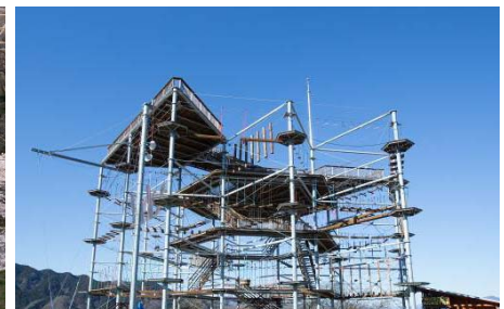
鳥肌コロシウム「マッスルモンスター」