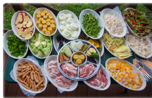
バーベキュー食べ放題 大人:2,500円 小人:2,200円