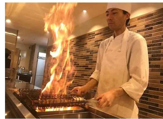
(炎の薫焼きイメージ)