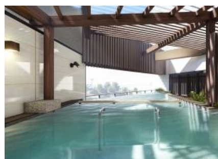
(露天風呂イメージ)