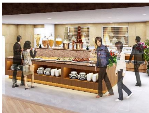
(ブッフェテーブルイメージ)