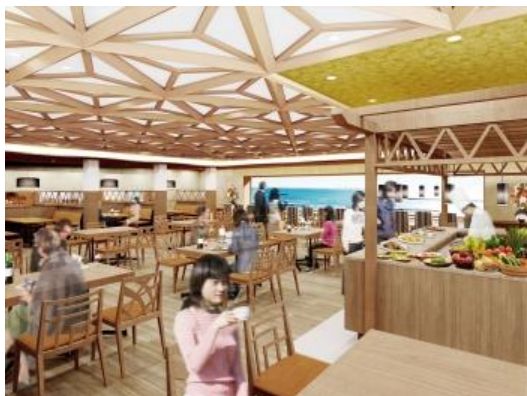
(メインダイニングイメージ)

が撮りたくなること間違いありません。さらに夕食時はライトアップされたサンビーチを、朝食時は朝日にきらめく相模湾を一望できる窓側の席はすべてカウンター席となっており、おひとり様でも気軽にご利用いただけます。