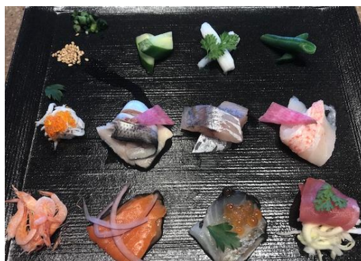
(手織り寿司イメージ)