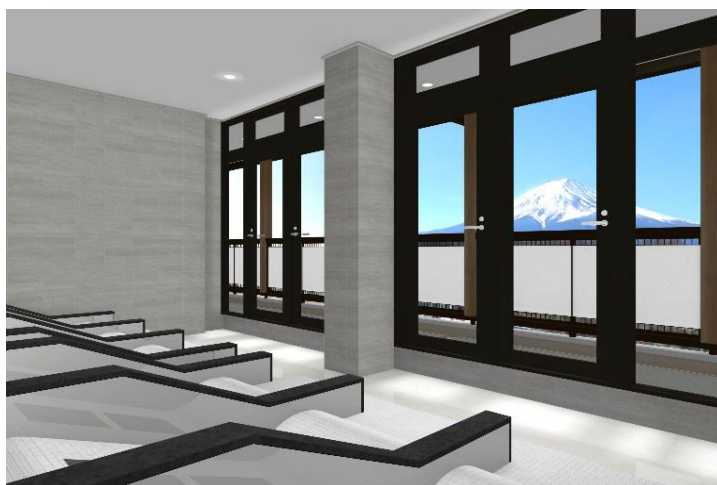
4階 富士山展望岩盤浴(イメージ)