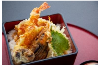
信玄鶏と四季野菜の天重 1,250円