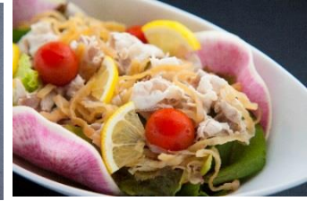
富士桜ポークと コリコリくらげのピリ辛サラダ 750円