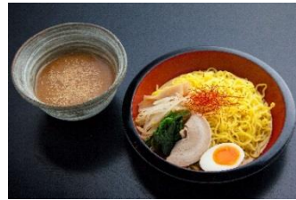
fujiyama 和風つけ麺 850円