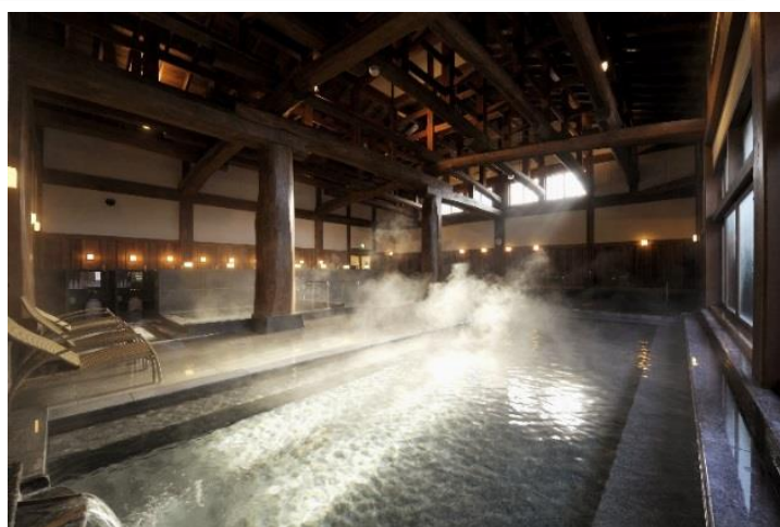
日本最大級の純木造浴室

富士山の麓に湧く自家源泉と絶好のロケーションを楽しめる「ふじやま温泉」(山梨県富士吉田市)が、平成 30 年 7 月 14 日(土)にリニューアルオープン致します。