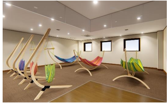
3階 ハンモック休憩室(イメージ)

3階の休憩室エリアには、富士山側を望む広々とした畳敷き休憩室のほか、新たにハンモックエリアやキッズルームを増設します。ハンモックエリアには、チェア型・寝ころび型計6台のハンモックが置かれ、快適な寝心地を体験できます。3階休憩エリアは、ふじやま温泉入館のすべてのお客様がご利用いただけます。