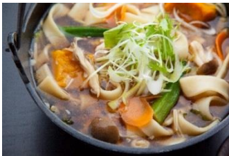
信玄鶏と四季野菜のほうとう 1,350円

ふじやま温泉内のレストラン 創作旬彩「ふじやまダイニング」では、グランドメニューを刷新！銘柄鶏「信玄鶏」を使ったメニューが新しく登場。中でも山梨県の郷土料理「ほうとう」に信玄鶏を使用した、「信玄鶏と四季野菜のほうとう」(1,350円)がおすすめ。その他にも地元産の食材にこだわった料理・地ビールなど、富士の恵みをお楽しみいただけます。