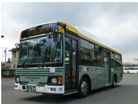
富士急グループ路線バス

ポップサーカスは、世界から集結したサーカスパフォーマーが肉体を極限まで駆使したアーティスティックなパフォーマンスを披露する、全国約50都市で延べ1,000万人の観客動員を誇る日本有数のサーカスで、今回、「WORLD TOP PERFORMERS」と銘うち、『ポップサーカス富士公演』が開催されます。世界屈指の13ヶ国のパフォーマー達が繰り広げる、圧倒的なパフォーマンスはまさに「夢のストーリー」です。