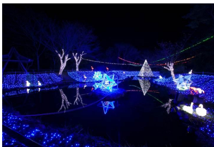
光のアクアガーデン