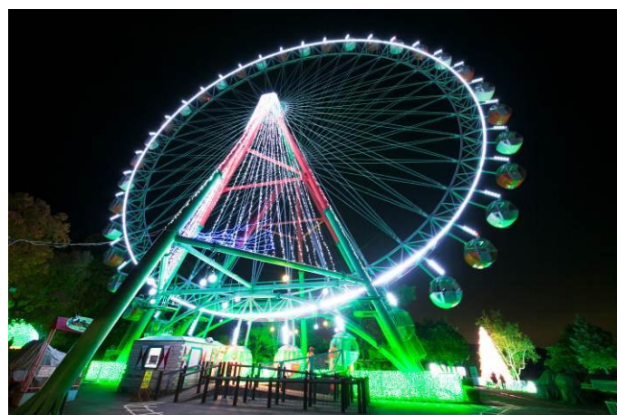
お山のかんらんしゃ