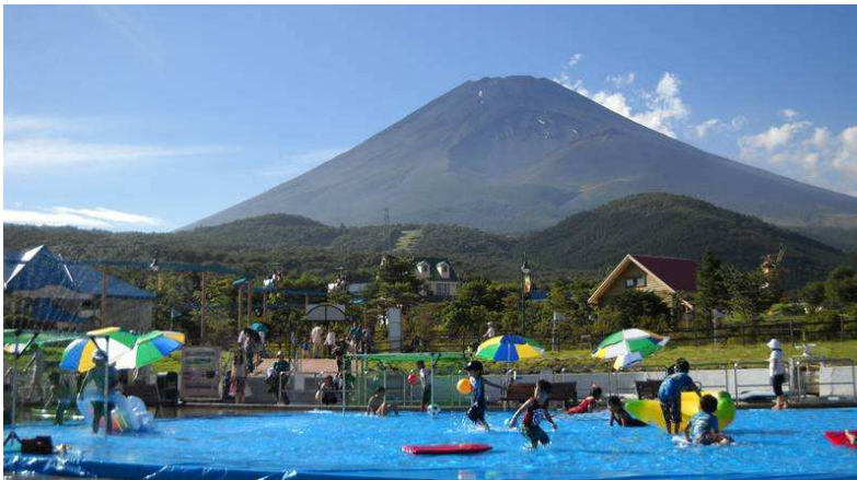
水遊び「アメンボ広場」

水遊び・雪遊びや自然観察、震災復興支援など、 “天然の涼しさ”の中で楽しめるイベントが盛りだくさん