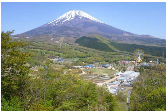
自然観察イベント（「黒塚」からの眺め）