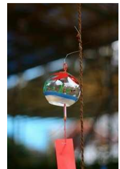
風鈴ビンゴラリー