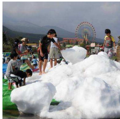
真夏の雪遊び広場