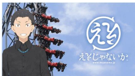
ナツキ・スバル × ええじゃないか

園内では、5人のキャラクターがそれぞれアトラクションとコラボ。フォトスポットが設置されるほか、アトラクションの出発の合図や運転のアナウンスが切り替わります。組み合わせは以下の通りです。