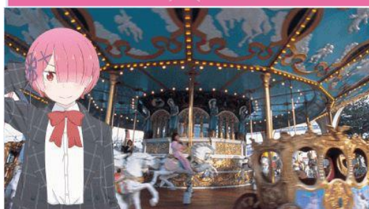
ラム × メリーゴーラウンド