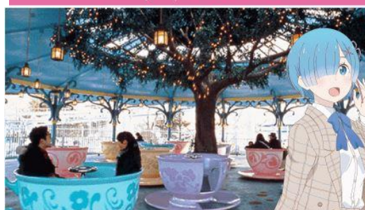
レム × ティーカップ