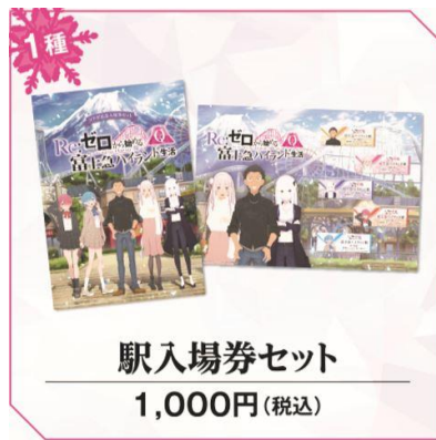
駅入場券セット 1,000円(税込)