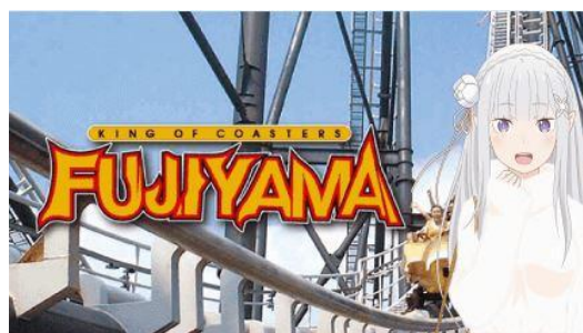
エミリア × FUJIYAMA