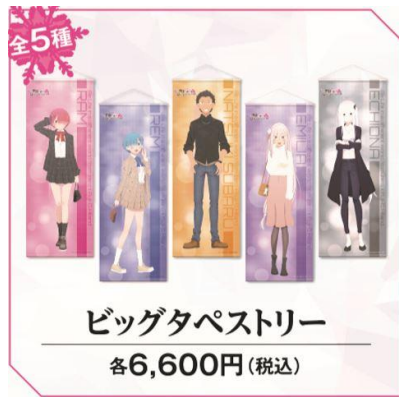
ビッグタペストリー 各6,600円(税込)