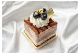
エキドナの茶会ケーキ 600円 (税込)