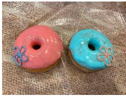
ラムとレムの仲よしドーナツ