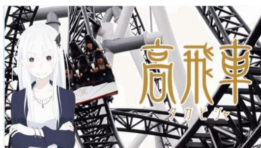
エキドナ × 高飛車