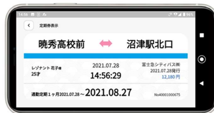
※定期券表示画面イメージ

富士急グループの株式会社レゾナント・システムズは、バス定期券をスマホ上で購入し、券面を画面表示できるスマートフォンアプリ「チケパス」を2021年8月10日（火）12時より配信開始いたします。