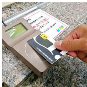
キャッシュレス決済を推奨