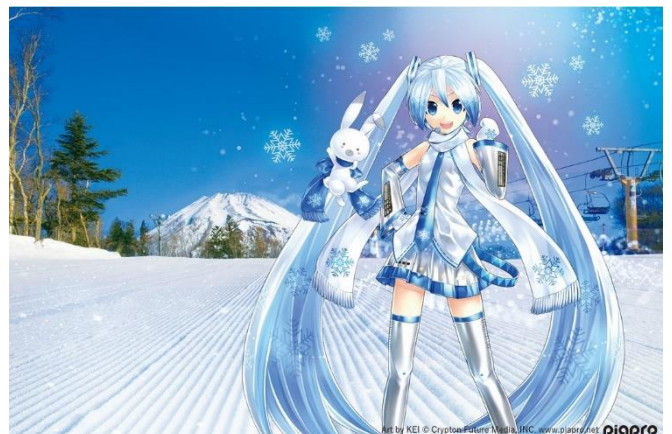
コラボビジュアル

※SNOW MIKU ポータルサイト https://snowmiku.com/