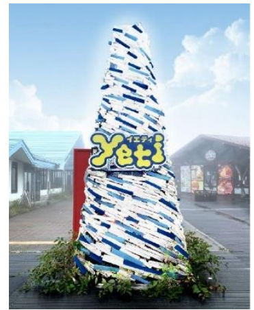
雪ミクツリー(イメージ)

ダイナミックな「雪ミク」のビジュアルがお迎えしてくれるウェルカムパネルや隣に並んで写真が撮れる等身大パネル等、様々なフォトスポットが登場いたします。木製のシンボルツリーも今年は青と白の「雪ミク」カラーにデコレーションされます。