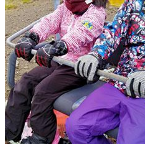
リフト乗車時のグローブ着用