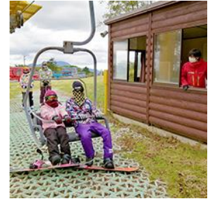
リフトはグループごとにご案内

※上記以外にも場内各所で感染症対策を実施しております。詳細は公式サイトにてご確認ください。