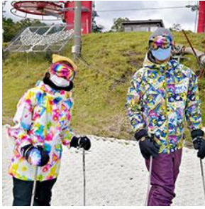
ゴーグル着用の推奨