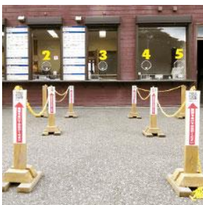
間隔を空けてお並びいただくようご案内を設置

スノーパーク イエティでは、「三密対策」と「お客様・スタッフの健康管理」の2つを軸に感染症予防対策を徹底しております。場内各所で実施している取り組みは下記の通りです。