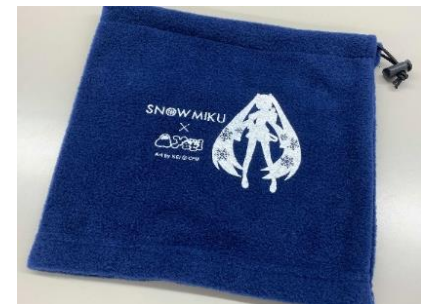
コラボ限定ネックウォーマー

「雪ミク」のシルエットが描かれたオリジナルネックウォーマー付きのコラボチケットが登場。スタイリッシュなデザインのネックウォーマーは、これからの寒い冬、重宝すること間違いなしです。アクセスに便利なバスセット券も販売いたします。