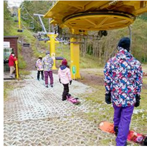
リフト乗車時および待ち列で 間隔を確保