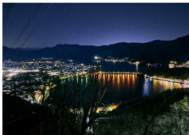
「絶景パノラマ回廊」から見る河口湖