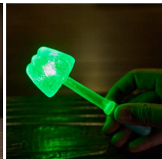
ふじちゃんフラッシュキャンデー (440円)