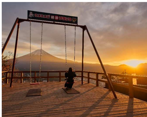
「カチカチ山 絶景ブランコ」から見る夕焼け