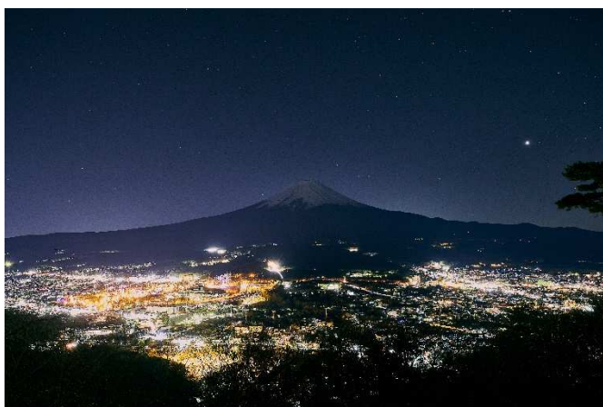
「展望広場」から見る夜景

夕方から夜にかけて空には星が瞬き、眼下には夜景が広がっていく。普段はスタッフしか見ることのできない絶景です。標高 1,075m と、河口湖周辺でも高い場所に位置するため、眼前に輝く街明かりと富士山のシルエットはここでしか見ることのできないとおきの景色です。