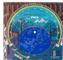
PICA オリジナル星座早見盤