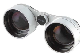
星空観察用双眼鏡