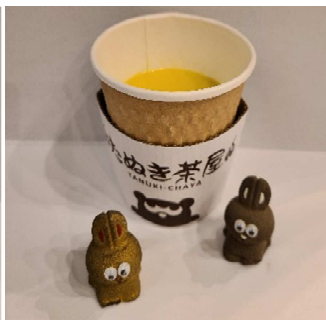
お月見ポタージュ (300円)