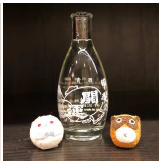
熱燗「甲斐の開運」 (400円)