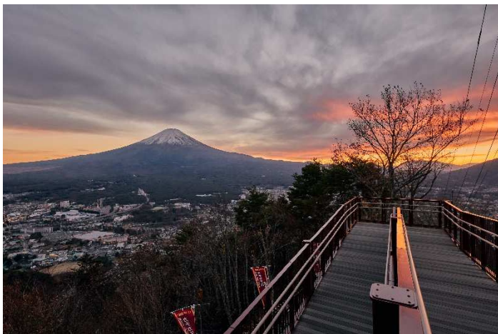
「絶景パノラマ回廊」から見る夕焼け

ロープウェイ山頂の展望広場や「絶景パノラマ回廊」からは、眼前に広がる大パノラマが一面鮮やかな夕焼け色に染まり、そこから段々と紫～濃紺へと変わっていく、空と富士山が織りなす絶景をお楽しみいただけます。「カチカチ山 絶景ブランコ」では、まさにその絶景に飛び込むようなとおきの非日常体験を味わうことができます。