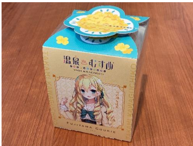
「おんせん娘」河口湖多佳美パッケージ 980 円