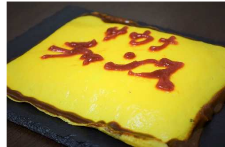
※こちらの写真はデコレーション例です

誰もが童心に帰ることのできるメニュー・オムライスとサウナマットが夢のコラボレーション。お絵かきケチャップ付きなので、思いのままにデコレーションができるのもまた嬉しいポイントです。縁取りのデミグラスソースと合わせて食べるとまた違った味わいを楽しめる一品です。