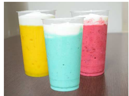
※写真は全てイメージです