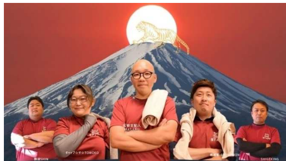
ふじやま温泉所属の熱波師軍団