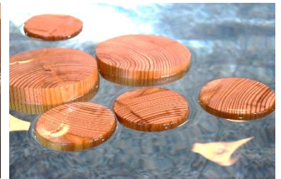
カラマツ風呂(イメージ)