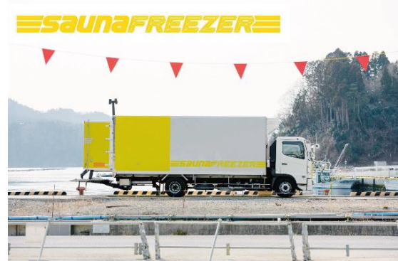
（左：WATら 写真：池田晶紀、右：サウナフリーザー）